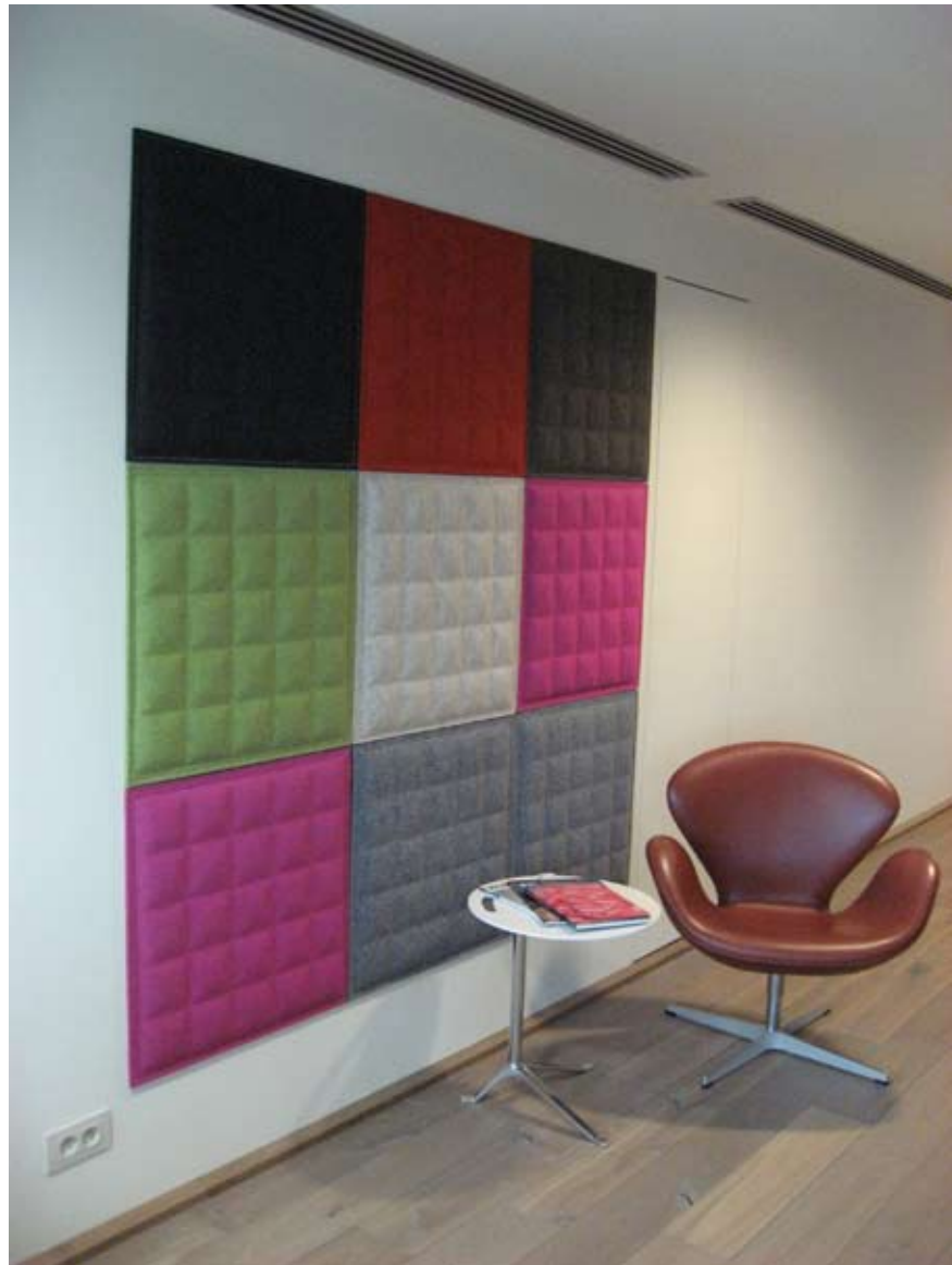
BuzziSkin 3D tiles

De aanbevelingen en gegevens zoals vermeld in dit productblad zijn zo volledig en correct mogelijk weergegeven, maar bieden geen garanties. Raadpleeg bij twijfel één van onze specialisten of voer zelf een test uit.