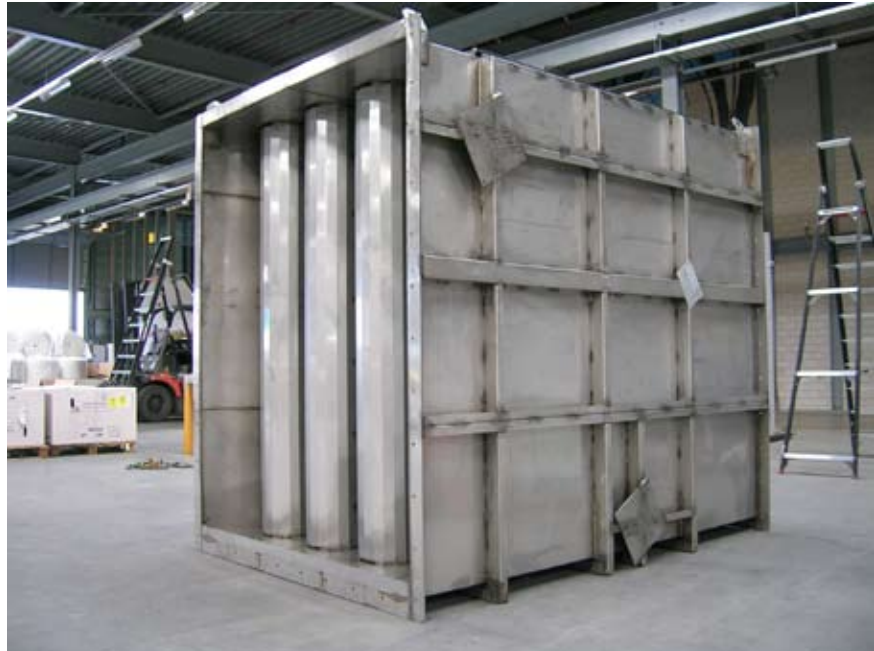
Geluiddemper type Z