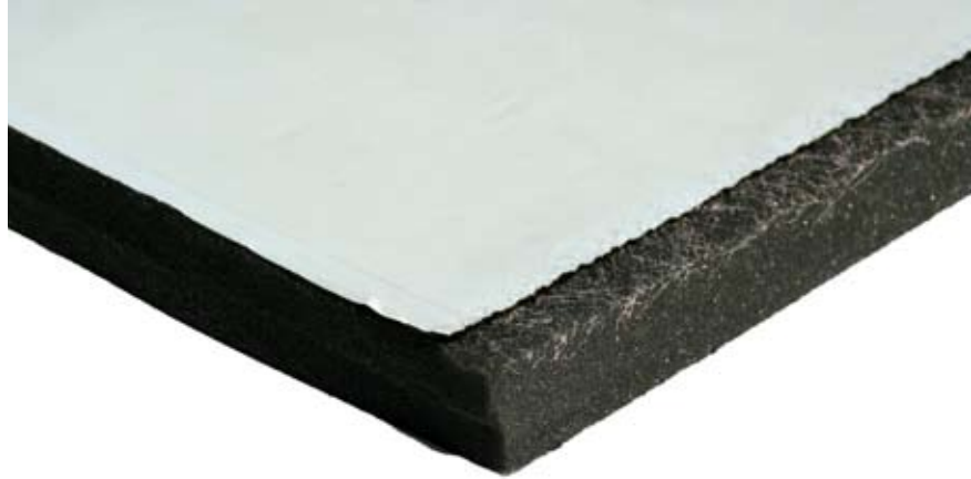
Onderzijde Merfodem plaat

De aanbevelingen en gegevens zoals vermeld in dit productblad zijn zo volledig en correct mogelijk weergegeven, maar bieden geen garanties. Raadpleeg bij twijfel één van onze specialisten of voer zelf een test uit.